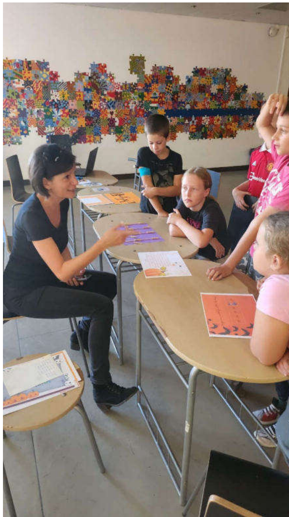
Csokit vagy csalunk! Halloween játszóház a 3–4. évfolyamnak