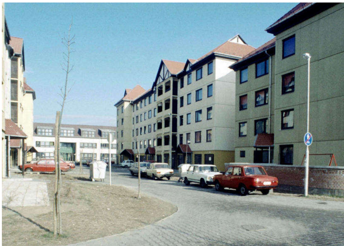
Fotó iskolánk megnyitásának évéből, 1988-ból